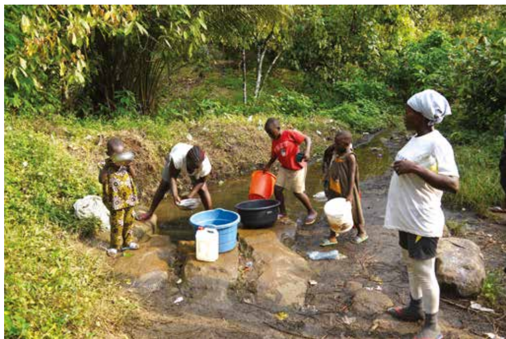
↑ DES HABITANTS DE DJOUNGO RAILS COLLECTENT DE L'EAU DEPUIS UNE SOURCE D'EAU STAGNANTE, FAUT D'EAU COURANTE. NOVEMBRE 2016.