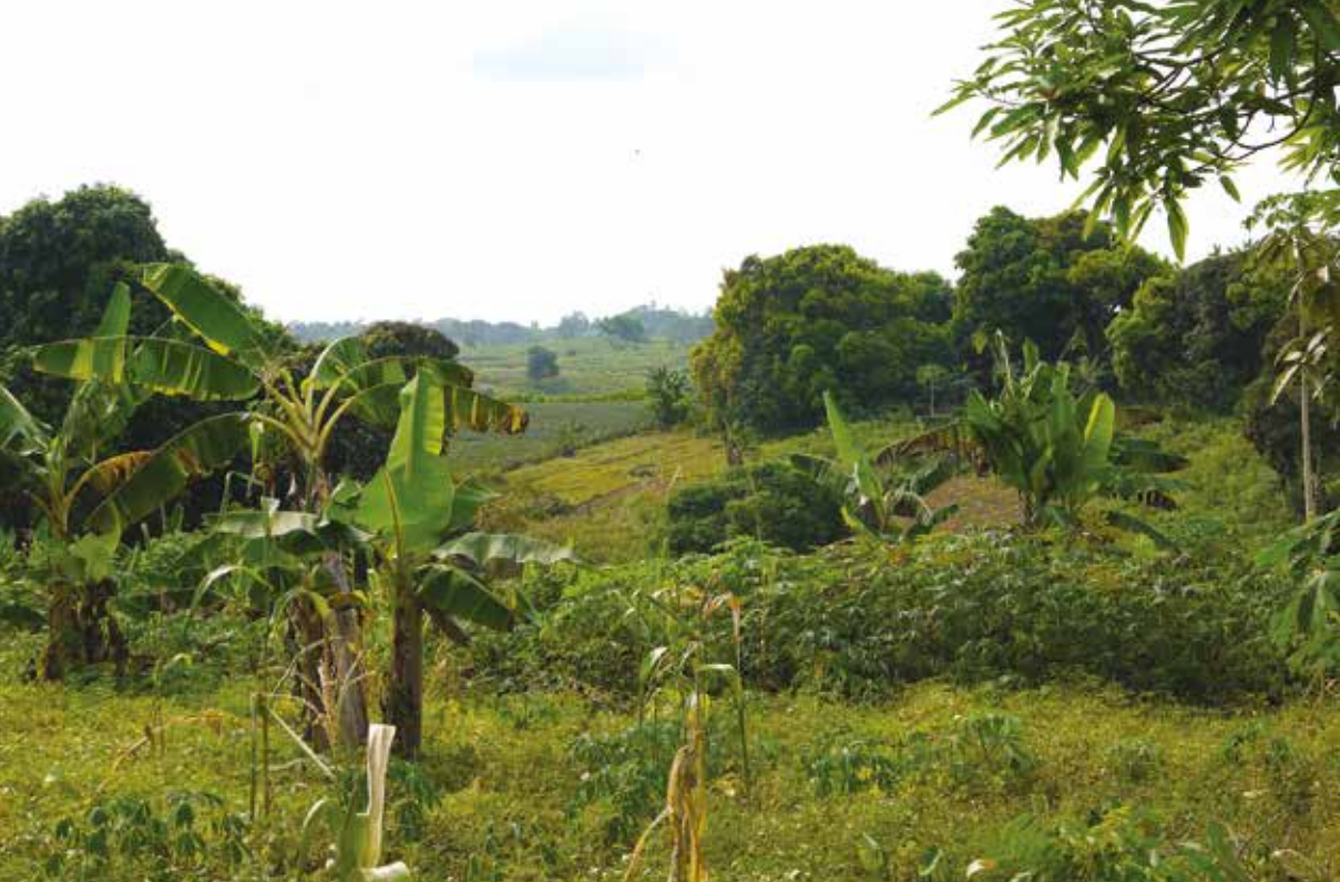
↑ CHAMPS CULTIVÉS AUTOUR DU VILLAGE DE DJOUNGO-RAILS.