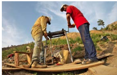
Kleinschürfer*innen bauen Gold in der Bonuur Mine in der Mongolei nachhaltig ab, d.h. hier zumindest ohne den Einsatz von Quecksilber.